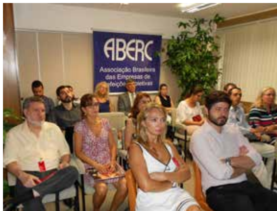
Participantes lotaram a sala de reunião da ABERC

este número já está em uma para cada 100 mil ovos”, afirmou.