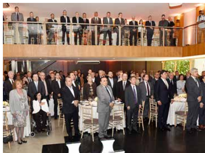
Os participantes postados ao ouvirem o Hino Nacional Brasileiro