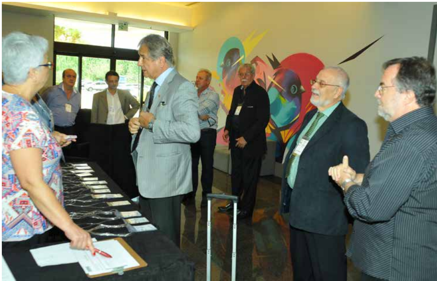
Recepção do evento

Para o primeiro trimestre de 2018 está previsto mais um Encontro de Empresários.