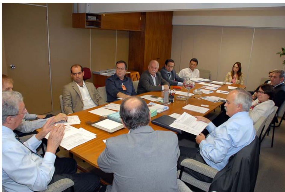
Na reunião de diretoria do dia 29 de junho, a ABERC contou com a presença de associados e de representantes de várias associações dos segmentos de refeições fora do lar