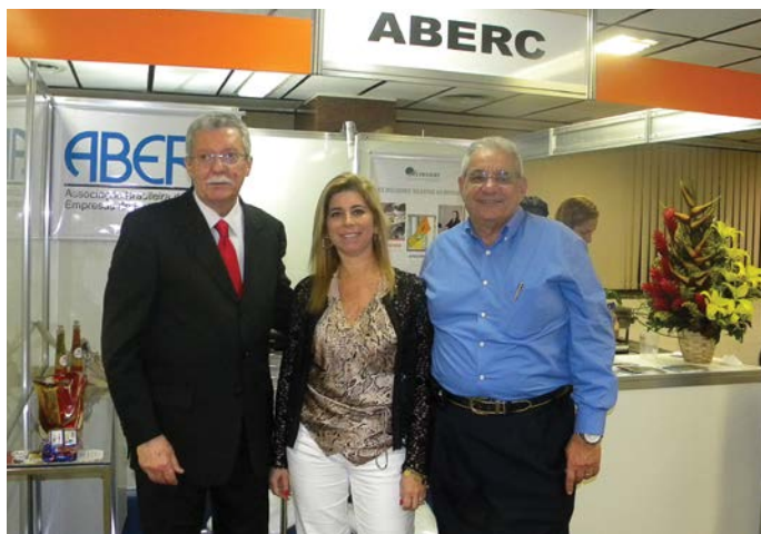
Estande da Associação e da parceira Ultraserv foi muito visitado

Além de um conjunto de palestras, o evento teve um espaço para exposição, com estandes de produtos e serviços. A ABERC, com a participação do diretor