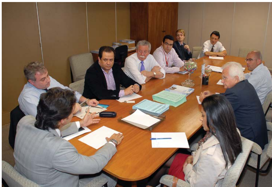
Flagrante da reunião da Comissão Jurídico-Fiscal na sede da ABERC

No dia 24 de setembro, a Comissão Jurídico-Fiscal da ABERC reuniu-se na sede da entidade para analisar a possibilidade de revisão de uma injustiça fiscal, quando da mudança de critério para contribuição do PIS-Cofins. O objetivo é desenvolver ações junto aos Ministérios envolvidos no Programa Brasil Maior, visando obter adequações para as empresas do segmento de refeições coletivas, como desoneração da folha de pagamentos, carga desigual de PIS/Cofins e taxação arbitrária do FAT/SAT.