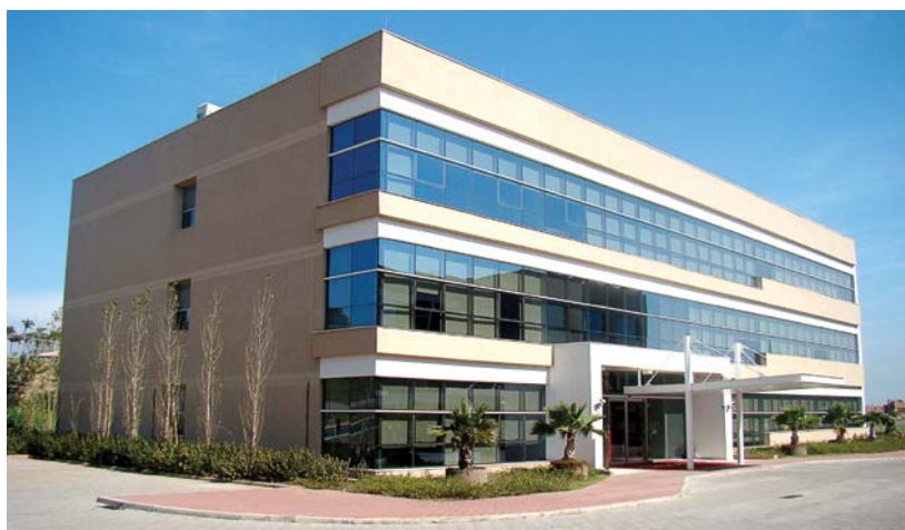
Ainda em Campinas, a empresa mudou-se para novas e funcionais dependências

Sediada em Campinas, a Sapore, fundada em 1992, completou 20 anos em julho com muitos motivos para celebrar: inseriu-se em todo o mercado nacional e, desde 2007, também expandiu sua atuação para o México e Colômbia; conta com uma plêiade de empresas brasileiras como tomadoras de seus serviços.