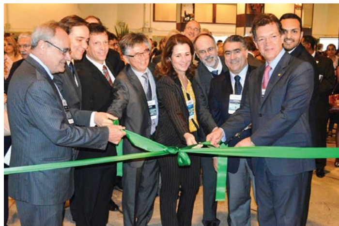
Ato da fita inaugural do Simpósio realizado em Brasília