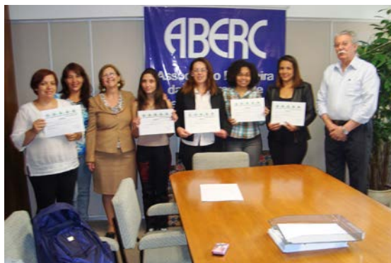
Participantes do curso de aperfeiçoamento para técnicos de nutrição