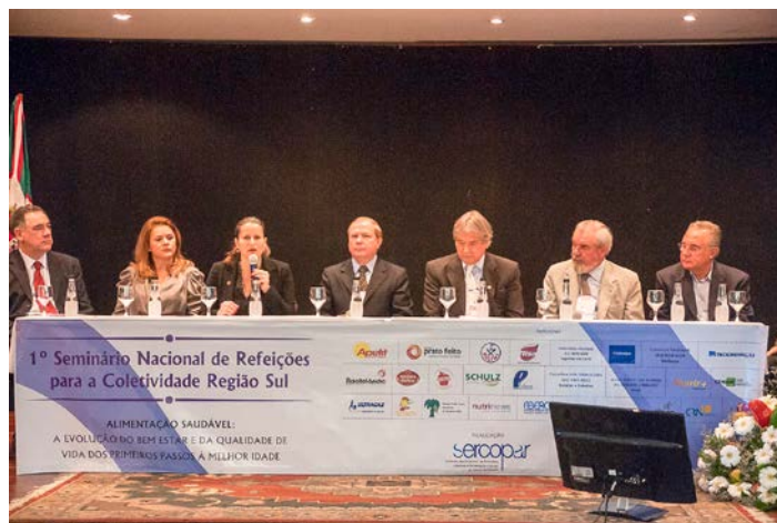
Flagrante da mesa de honra na solenidade de abertura do seminário

mento das refeições coletivas e sua dedicação e trabalho, por décadas, em prol do segmento.