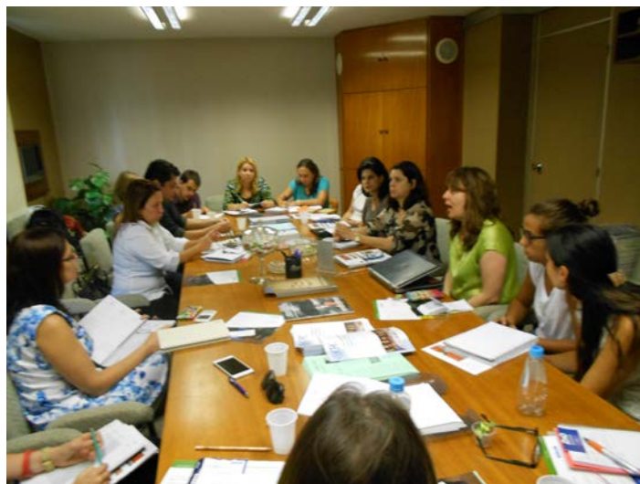
O evento, na sede da ABERC, reuniu profissionais de nutrição, microbiologia e fornecedores do segmento de alimentação