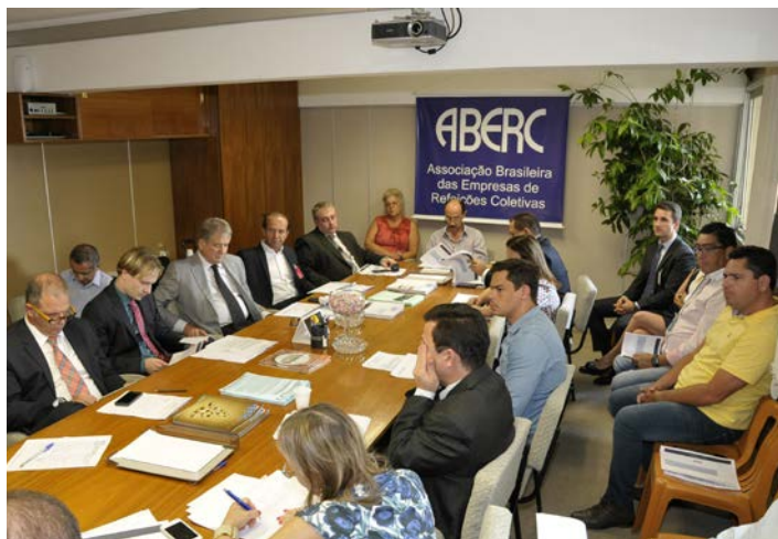
Flagrante da Assembleia Geral Ordinária na sede da ABERC