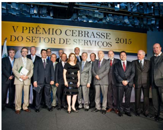
Diretoria da CEBRASSE no encerramento da cerimônia, no Maksoud Plaza